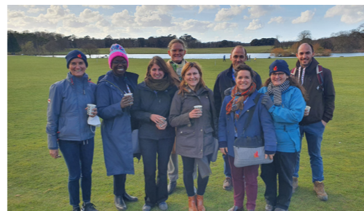
Participation au CSC 2022 au Royaume-Uni